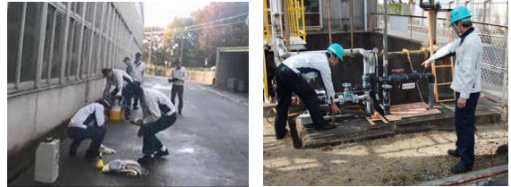
雨水側溝への油流入を想定した訓練の様子

工場から排出される排水処理前の汚水は、社外に流出し環境事故を起こさないよう、管理を徹底しています。一方で、万一が発生した“もしも”の場合にも対応できるよう社外への流出防止訓練も定期的を実施しています。