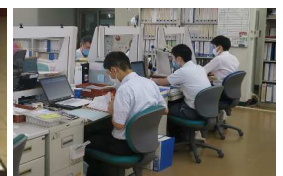
ハローテーション(津田本社)